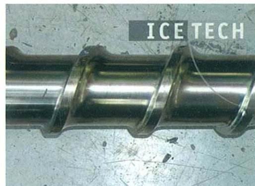
Figura 3. Antes de aplicar la limpieza criogénica - Después de aplicar la limpieza criogénica.