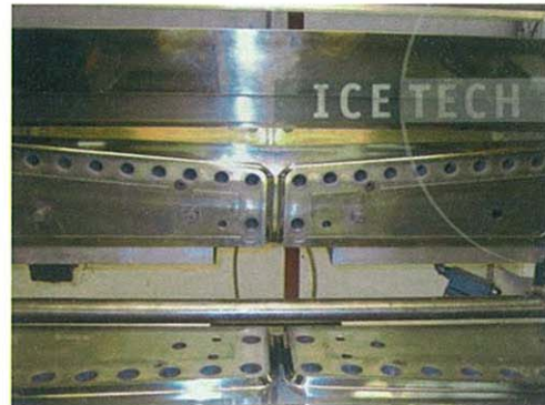
Figura 2. Antes de aplicar la limpieza criogénica - Después de aplicar la limpieza criogénica.